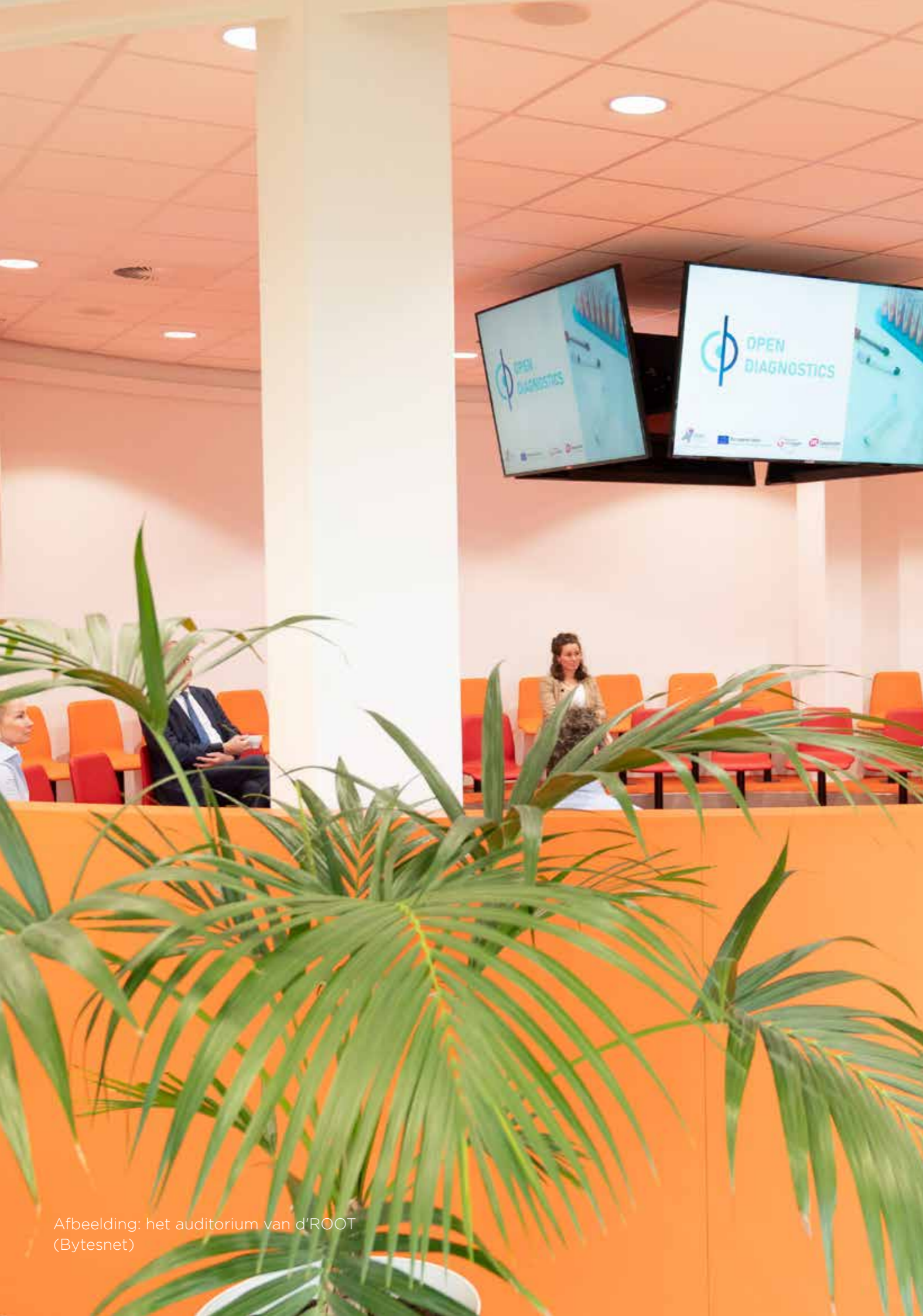
Afbeelding: het auditorium van d'ROOT (Bytesnet)