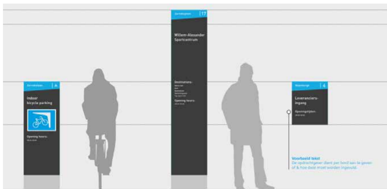
Figuur 1: Voorbeeld adresbord bij nieuw pand op Zernike Campus Groningen

Op het moment dat er een nieuw adres op de Zernike Campus komt, dan zorgt de campus ervoor dat er een zuil komt voor dit nieuwe adres. Het zuil en de borden worden in de huisstijl van Campus Groningen ter beschikking gesteld ten behoeve van de uniformiteit op het terrein. Deze dienst is eveneens onderdeel van het eerdergenoemde kwaliteitshandboek .