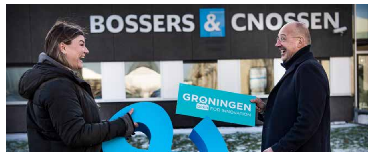
Afbeelding. Groningen Open challenges (Antea Group en Bossers & Cossen)